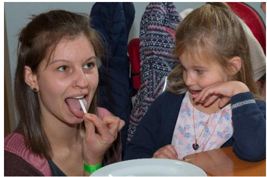
14| BIOTOPIA Festival SINNE: Mitmachprogramm