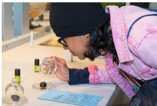
9| BIOTOPIA Festival SINNE: Sinne Display