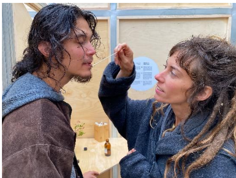
5| BIOTOPIA Festival SINNE: Cognition, Values, Behaviour Lab (CVBE), Ludwig- Maximilians-Universität München - Das multisensorische Labyrinth