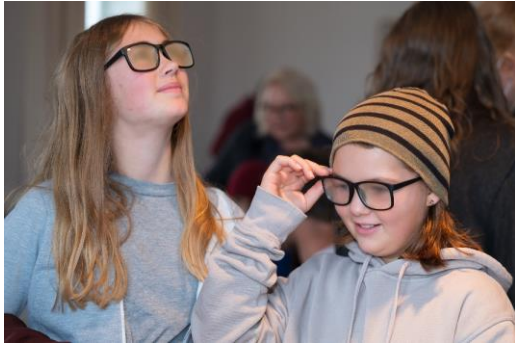
13| BIOTOPIA Festival SINNE: Kinder beim Mitmachprogramm