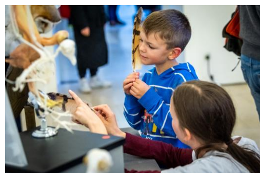
6| BIOTOPIA Festival SINNE: Zoologische Staatssammlung München - Sinneswunder Eule