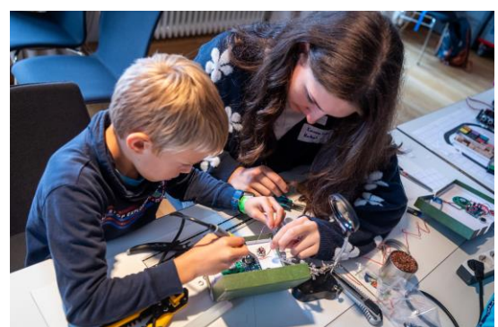
12| BIOTOPIA Festival SINNE: RoBat - Was fühlt ein Roboter?