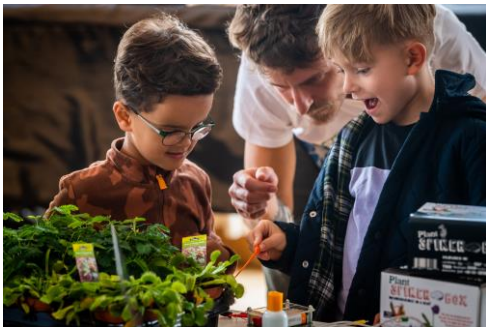
1| BIOTOPIA Festival SINNE: Mitmachprogramm

Weitere Pressefotos von BIOTOPIA und BIOTOPIA Lab stehen auf www.biotopia.net/presse zum Download bereit.