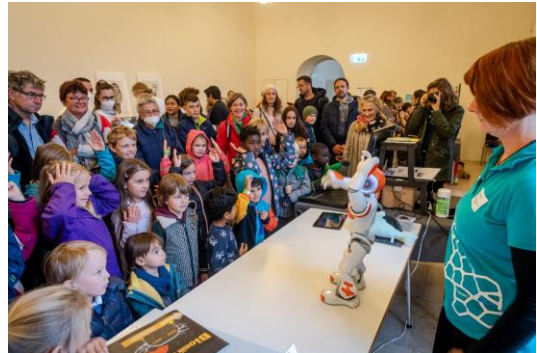
8| BIOTOPIA Festival SINNE: Tierische Sinne – Natur als Vorbild für Technik, Bionicum Nürnberg