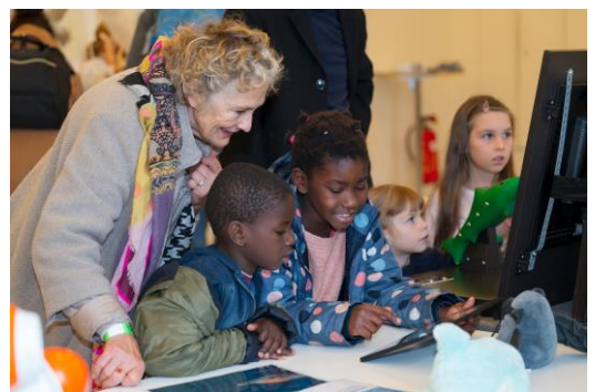
10| BIOTOPIA Festival SINNE: Sinne Display